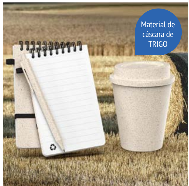
TH 215 Set Trigal