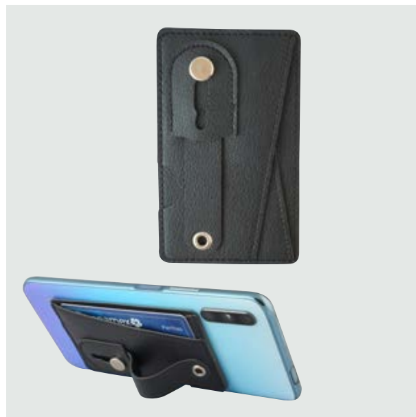
TEC 244 Tarjetero Hook

Material: Plástico y Silicón Medida: 6.2 cm diámetro